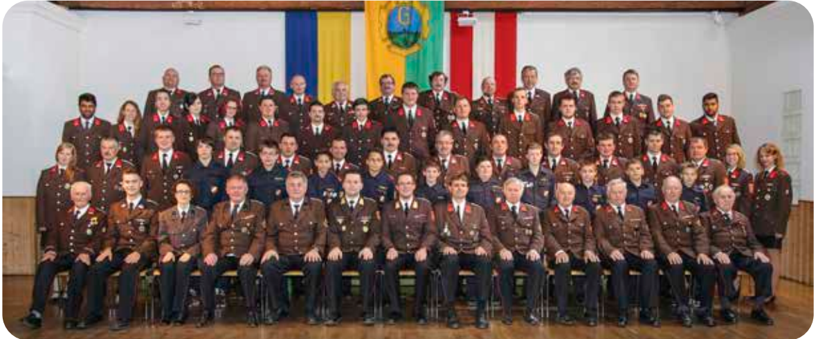
Mannschaftsfoto Juni 2015

Wir möchten Sie auch in Zukunft zu unseren Aktivitäten sehr herzlich einladen, damit wir auch weiterhin unser Aufgaben im Sinne der gesetzlichen Grundlagen für unsere Bevölkerung erfüllen können.