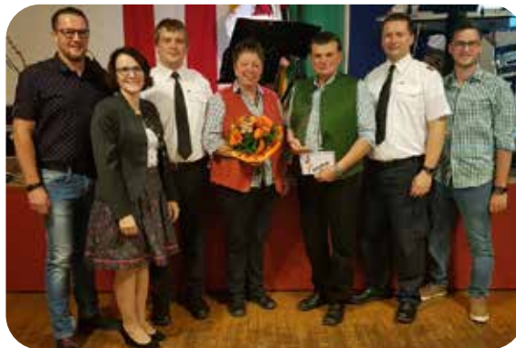
HLM Erwin Neuteufel zum 50. Geburtstag